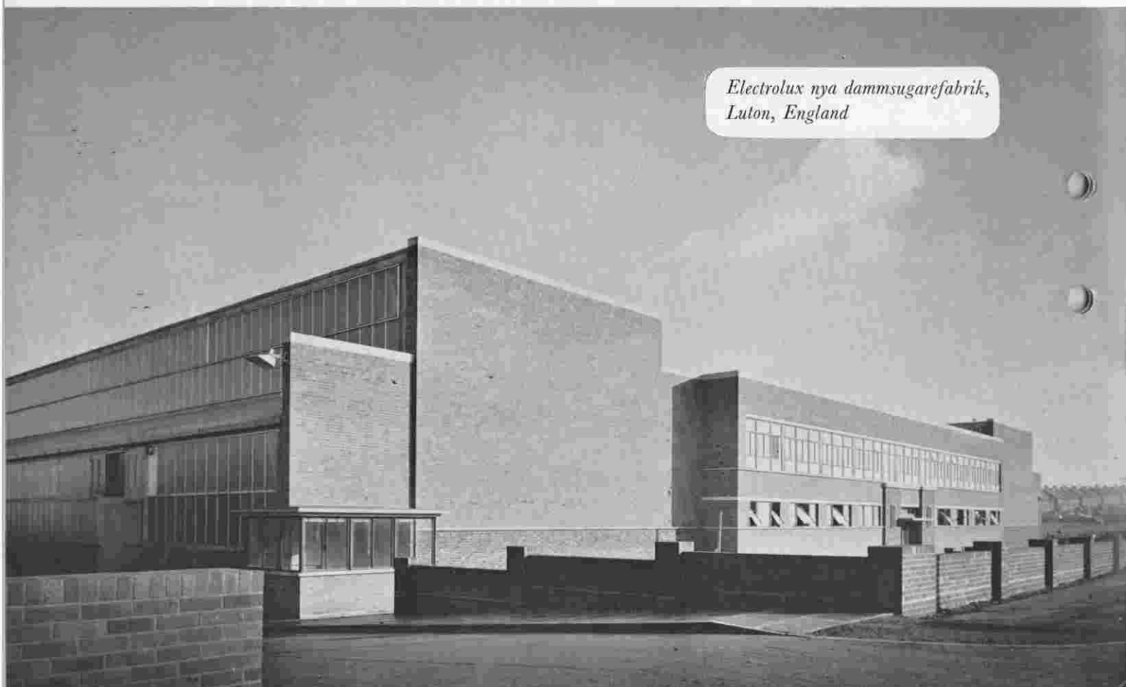
Electrolux nya dammsugarefabrik, Luton, England

Styrelsen och verkställande direktören begagnar detta tillfälle att tacka Electrolux anställda av alla kategorier för det intresse och den entusiasm, varmed de under det tilländalupna året utfört sitt arbete. Ett tack riktas också till agenter, återförsäljare och kunder i olika delar av världen för visat förtroende för bolaget och dess produkter.